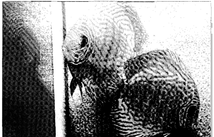
Faszinierend und farbenprächtig sind die wunderschönen Tiere immer eine Zierde in den Aquarien.

Um Geld geht es Hilsenbeck bei der Diskus-Zucht längst nicht mehr. „Das Hobby hat eine gewisse Faszination“, gesteht er, „wenn man sich tiefer damit beschäftigt, in das Biotop hineinschaut und dabei nur eine Frage klären kann, tun sich drei neue Fragen auf.“ So hat ihn sein Hobby über die Jahre zum Spezialisten gemacht. Von einer Aquarienzeitschrift besitzt Hilsenbeck seit 1948 bis heute jede Ausgabe. „Selbst in größter Not – davon könnte ich mich nicht mehr trennen“, gesteht er. An populärwissenschaftlicher Literatur hat er mittlerweile kein In-